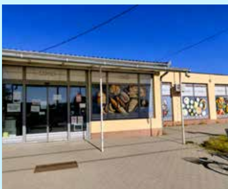
Dunavecse Mini Coop

És most újabb izgalmas fejezet kezdődik.