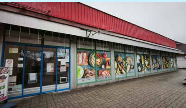
Dunavecse Coop Szuper

A jövő tehát izgalmasabb, mint valaha – és a HUNOR készen áll arra, hogy együtt írja tovább ezt a sikertörténetet.