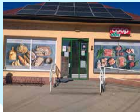
Tass Coop ABC

A Dunavecse környéki üzletek csatlakozásával nemcsak a bolthálózat bővül, hanem új kihívások, új lehetőségek teremtődnek. Megszépülő üzletek, tágas terek és friss lendület várja a vásárlókat, törzsvásárlókat – mindez pedig újabb bizonyítéka annak, hogy a társaság továbbra is a fejlődés, az innováció útján halad.