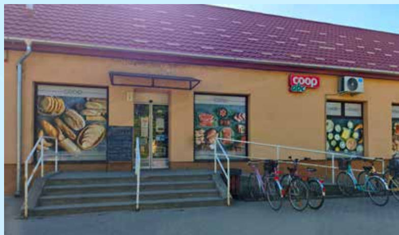
Szalkszentmárton Coop ABC