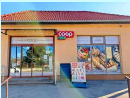
Apostag Coop ABC

A Hunor Coop Zrt. története során már többször is megmutatta, hogy nyitott az új lehetőségekre, és elkötelezetten keresi azokat az utakat, amelyekkel még hatékonyabbá teheti közösségét.